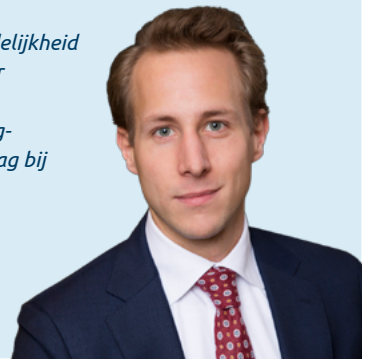
Vincent Vink Werknemerslid

'Wij willen fatsoenlijk zakendoen. Daarom nemen wij onze verantwoordelijkheid op het gebied van ESG. ESG staat voor Environmental, Social en Governance. Met steeds de belangen van de belanghebbenden in het oog, dragen wij graag bij aan een duurzamere wereld.'